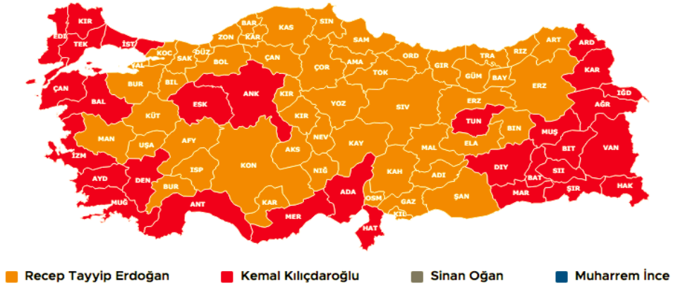
Şekil 2. 14 Mayıs 2023 Cumhurbaşkanlığı Seçimi Türkiye Geneli Sonuçları